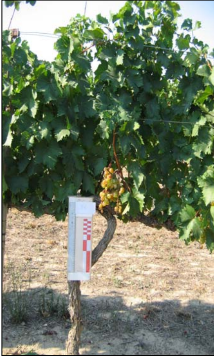
Porte de la planta